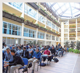
L'istituto di Verrès

Diventare un hub per la ricerca e l'innovazione e rispondere alle richieste delle aziende, anche nell'ottica dei bandi e fondi comunitari Horizon 2020. E' la «mission» che si dà il Polo tecnologico di Verrès, frutto della collaborazione tra la Regione Valle d'Aosta e il Politecnico di Torino, che ha aperto le sue porte una giornata per presentare la sua offerta. «Alle università tecniche - dice il pro-